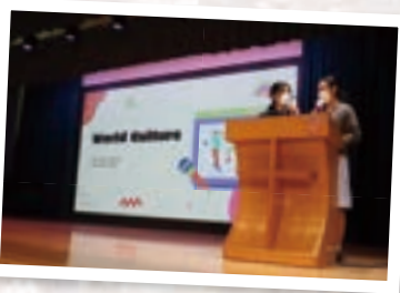
EAs exposed students to world culture

In July, we held the annual English Fiesta, themed around Global Cultures, to emphasize the power of English as a gateway to diverse knowledge and cultural understanding. We believe English is more than just a language; it fosters a global mindset in students, shaping them as informed global citizens. The event showcased various cultural activities, and the enthusiastic participation of students reflected their curiosity about different cultures and their potential to embrace cultural sensitivity.