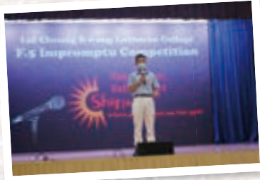
F.5 Impromptu Competitions are held twice every year