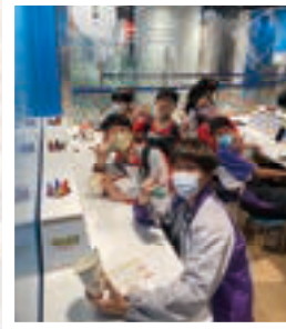
F.1 students visited Cup Noodles Museum