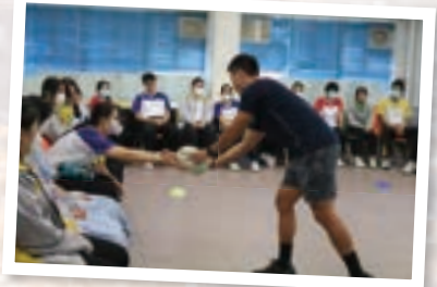
Students learnt how to play rugby, a sports played worldwide.